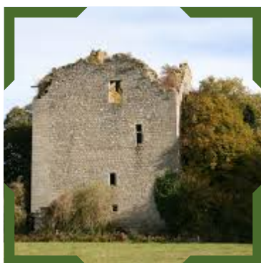
Tour de Chamborand