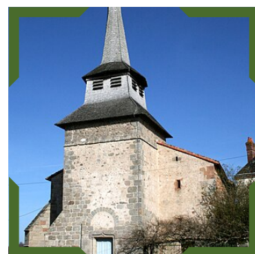
Eglise St Pierre de Fursac