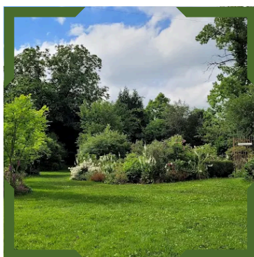
Jardin de la Sagne